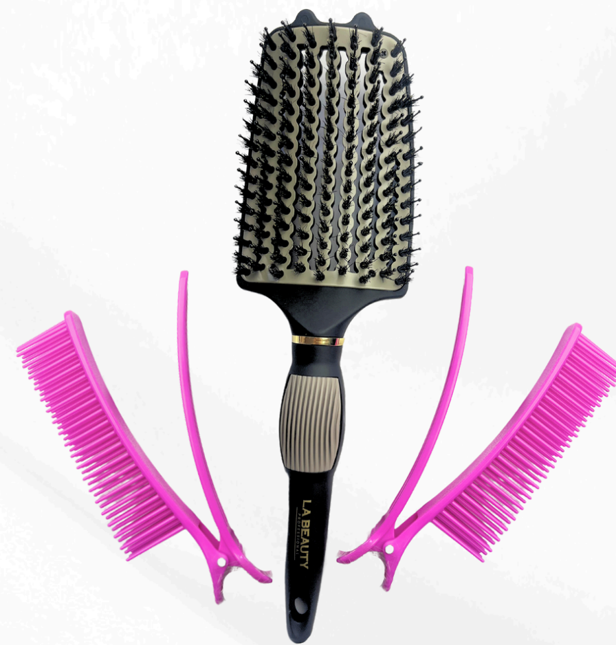
Vent hair brush Clips de seccionado