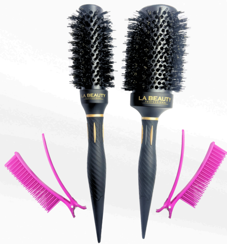
Ceramic brush de 53mm Ceramic brush de 32mm Clips de seccionado

Los cepillos de cerdas mixtas distribuyen aceites naturales y desenredan sin frizz, ideales para todo tipo de cabello, mientras que los peines para cardo añaden volumen y textura con dientes finos y punta de aguja para seccionar el cabello. Los clips de seccionado, con su sujeción firme y diseño ergonómico, mantienen el cabello en su lugar sin dejar marcas, siendo perfectos para cortes, peinados y coloración. Estas herramientas ofrecen control, versatilidad y un acabado profesional.