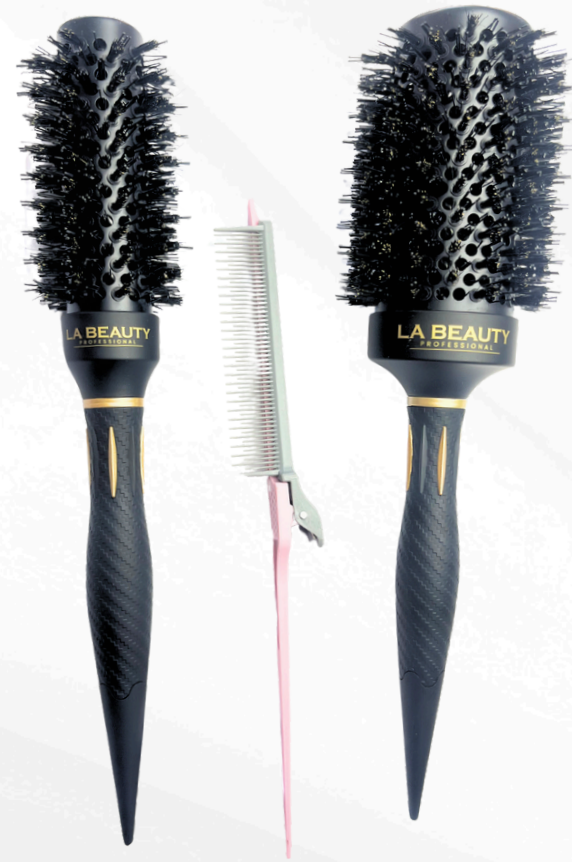
Ceramic brush de 53mm Ceramic brush de 32mm Peine para cardo