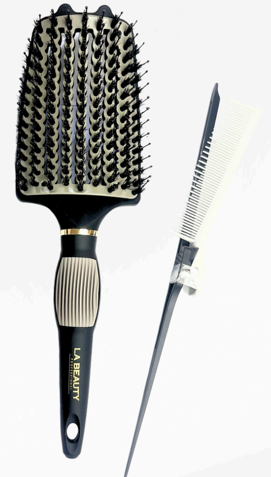
Vent hair brush Peine para cardo